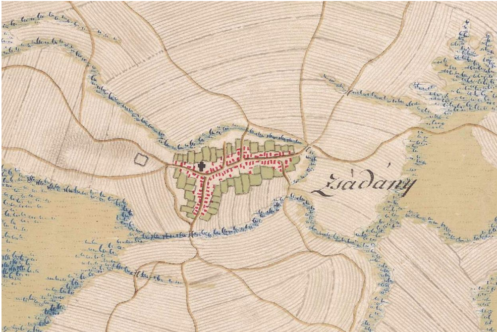
1. ábra Zsadány az I. katonai felmérés idején (1783)

Az urbáriumot végül is 1773-ban vezették be, s ezzel Zsadány is betagozódott az átlagos jobbágyfalvak közé. A kiváltságos állapot következményeként azonban az akkor 79 családból jobbágy volt 75, házas zsellér 2, házatlan zsellér pedig szintén 2. A jobbágytelkek szántóterülete összesen 382 és \frac{1}{4} holdat tett ki (Makai 1999).