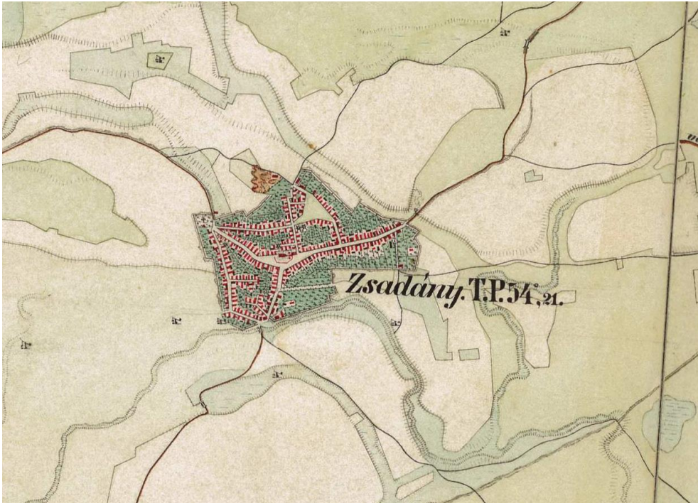
2. ábra Zsadány a II. katonai felmérés idején (1861)

Ahogy a legtöbb magyarországi falu esetében jellemző, Zsadányban sem voltak hirtelen és nagy változások. De azért a „ballagó idő” is megtette a magáét, s hosszabb időtávon nézve a településkép is jelentősen átalakult. Ez egyértelműen látszik pl. az I. és II. katonai felmérés lapjainak összehasonlítása esetén. A két felmérés között közel nyolc évtized telt el (1783, ill. 1861), ezalatt Zsadány népességszáma megduplázódott, s ennek következtében a beépített terület is érzékelhetően megnőtt. A II. József kori egyszerű útifalu új utcákkal bővül, s kialakult az a sajátos alaprajza, ami lényegében ma is jellemző.